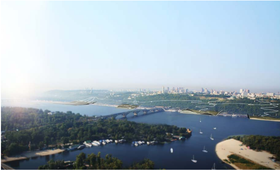
pié de imagen: TALLER 301/ Administración de la Ciudad-Estado de Kiev, Ucrania. Vista aérea de los puentes terrestres.